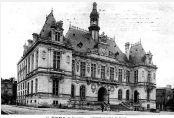
47. Niort et ses Environs — L'Hôtel de Ville de Niort