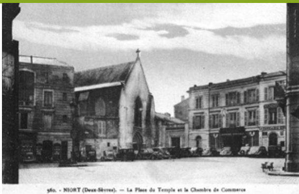
560. - NIORT (Deux-Sèvres). — La Place du Temple et la Chambre de Commerce