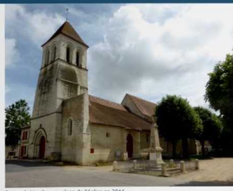
Bourg de Vendeuve, place de l'église en 2016.

En 1950, Anne-Marie Foucault achète un appartement rue Mange pour loger ses deux fils : Michel et Denys qui entame sa 3 e année d'école de médecine. Mais les deux frères, qui ont six ans d'écart, évoluent dans des cercles privés et professionnels très différents ; Michel s'installe en résidence à la Fondation Thiers, avant de partir à Lille. Pendant les vacances d'été, la famille séjourne dans une résidence secondaire à La Baule ou à la campagne, à une vingtaine de kilomètres au nord-ouest de Poitiers, à Vendeuve, dans la maison de la grand-mère maternelle, Marie Malapert. Le grand jardin accueille les trois enfants. Un espace de jeux et de liberté.