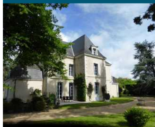
La maison de Vendevre en 2016.

« Je suis arrivé à Vendevre, c'est le temps des feuilles de papier qu'on remplit comme des paniers de pommes, des arbres qu'on taille, des livres qu'on lit ligne par ligne avec la méticulosité des enfants... C'est la sagesse de chaque été. »