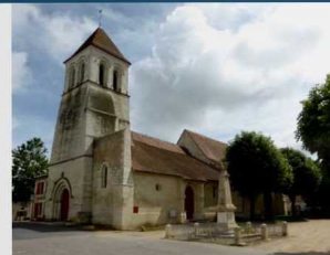
Bourg de Vendevre, place de l'église en 2016.