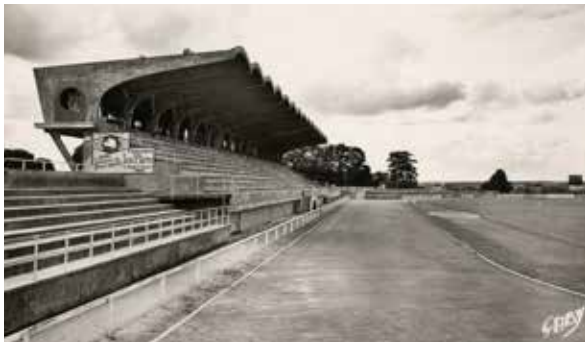
AM Niort_stade Espinassou

Rendez-vous au point accueil, place Denfert-Rochereau.