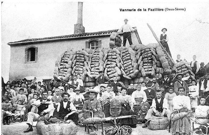
Les vanniers de la Fazillière à Vernoux-en-Gâtine, la première Scop de Gâtine, créée en 1911.